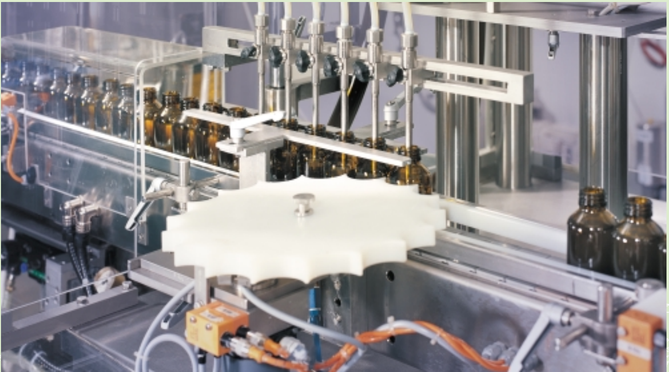
Medikamentenabfüllung bei Engelhard